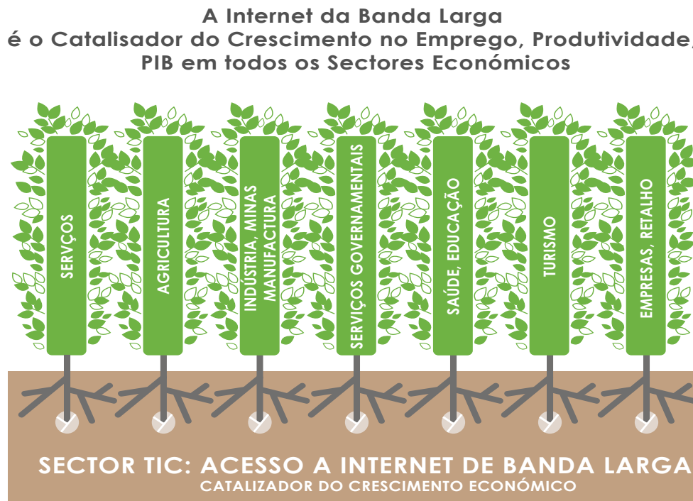
Figura 1: A Internet de Banda Larga é um Importante Catalisador para Crescimento Económico Disseminado 2

A redução proposta nos direitos aduaneiros não deve ser avaliada meramente como uma redução nos impostos para as operadoras de telecomunicações. Pelo contrário, a mudança deve ser reconhecida como uma iniciativa de política estratégica que não só otimiza o regime fiscal para apoio ao crescimento económico alargado em todos os sectores, mas também aumenta a criação de emprego, receitas fiscais e desenvolvimento social do país. Embora as receitas dos direitos aduaneiros possam baixar a curto prazo, é provável que esta descida seja compensada por um aumento na importação legal de equipamento e dispositivos de Telecom. Prevê-se que as receitas fiscais no geral aumentem a médio e longo prazo, através do aumento da compra de equipamento, dispositivos e serviços de telecomunicações, expansão do emprego e crescimento nas receitas comerciais e pessoais – todas suportadas pela maior procura, produtividade e eficiência em todos os sectores económicos. Este impacto económico alargado aumentará as receitas provenientes do Imposto de Valor Acrescentado (IVA), direitos aduaneiros e imposto sobre o rendimento de pessoas singulares e colectivas.